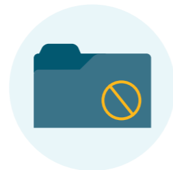
Sperren von Records